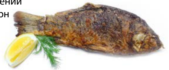
Карась смажений (100/15г) 58 грн Короп смажений (100/15г) 65 грн