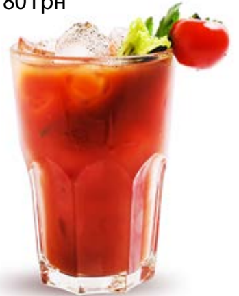
Кровава Мері 80 грн