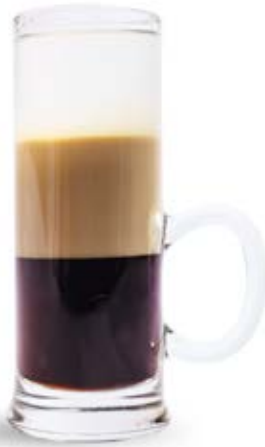
Б-52 80 грн