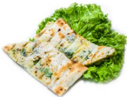
Лаваш запечений з сулугуні (150 г) 69 грн