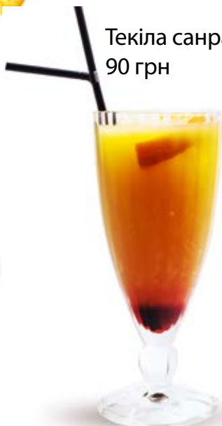
Текіла санрайз 90 грн