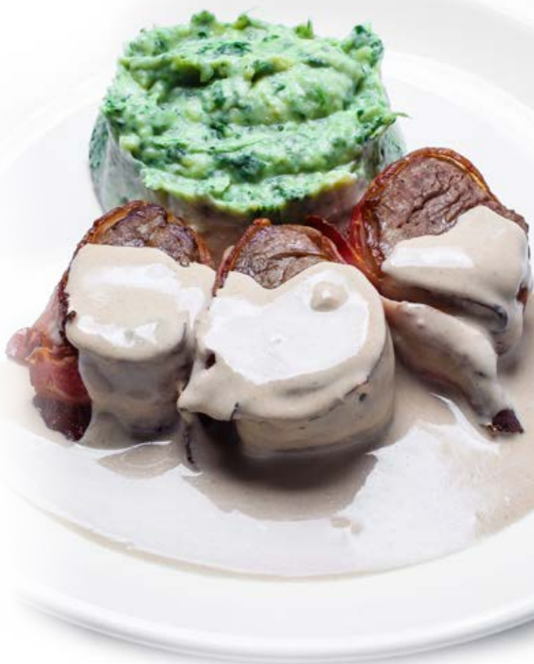
Медальйони зі свинини з соусом деміглас (400 г) 239 грн