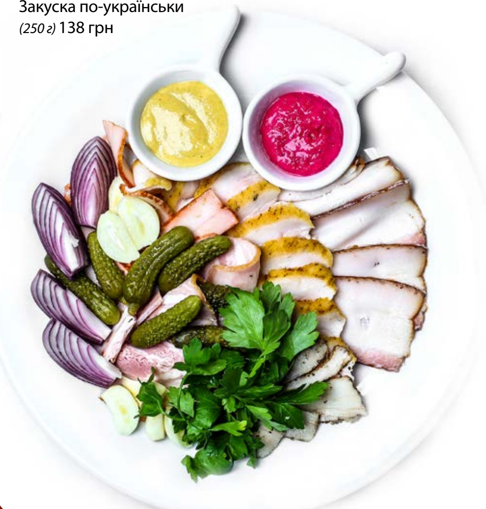
Закуска по-українськи (250 г) 138 грн