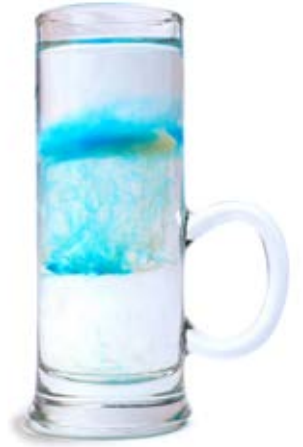
Медуза 80 грн