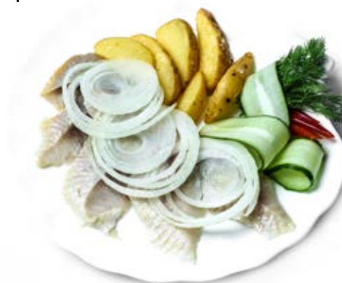
Оселедець під горілочку (200 г) 73 грн