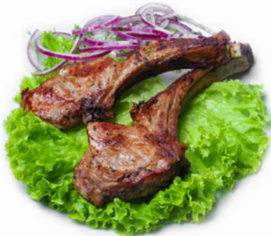
Шашлик з каре телятини (100 г) 110 грн