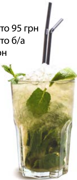
Мохіто 95 грн Мохіто б/а 60 грн