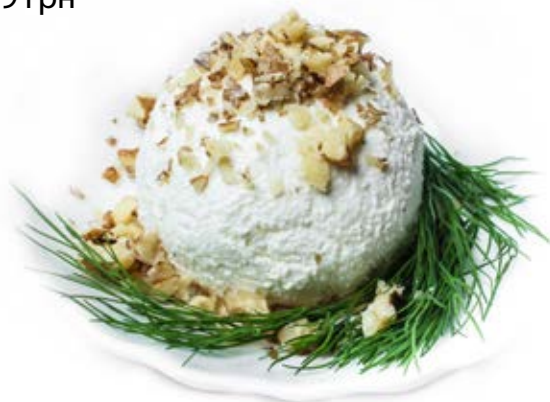
Шор (105 г) 59 грн