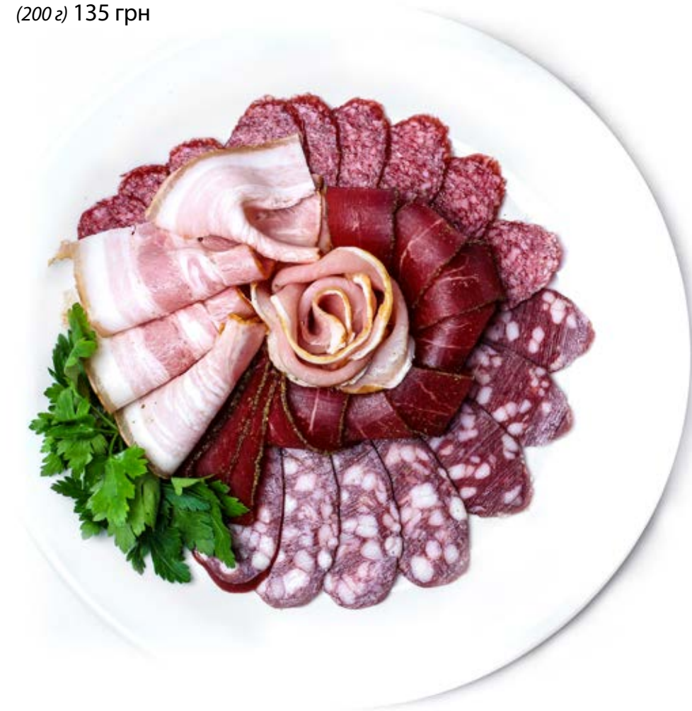
М'ясна тарілка (200 г) 135 грн