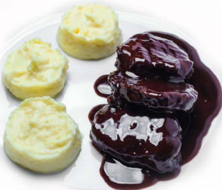
Медальйони з яловичини (300 г) 259 грн