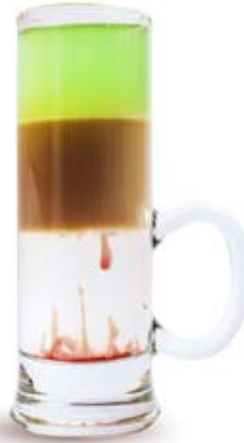
Хіросіма 80 грн