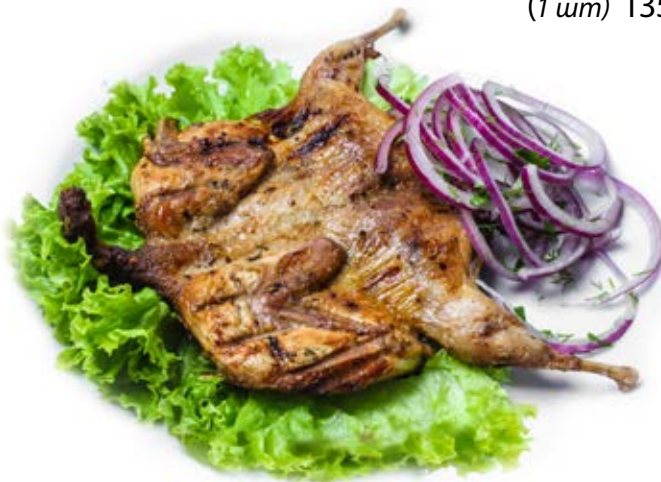
Перепілка (1 шт) 135 грн