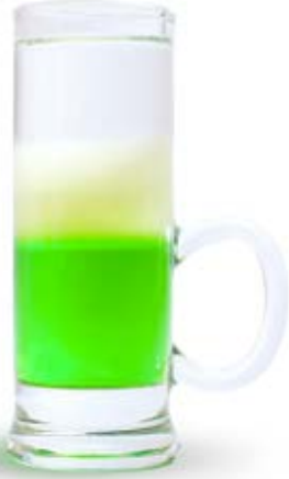
Зелений мексиканець 80 грн