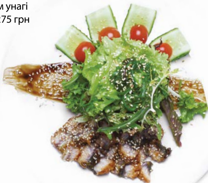
Салат з вугрем під соусом унагі (250 г) 275 грн