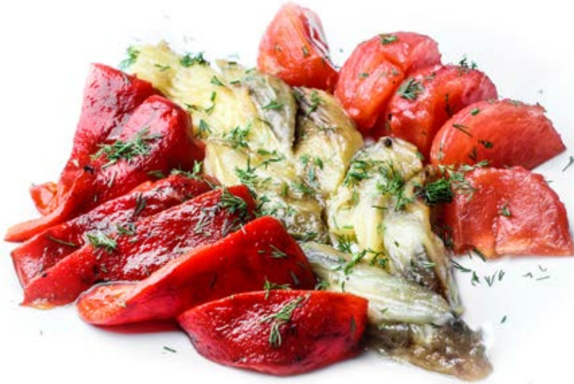
Овочі печені (300 г) 128 грн