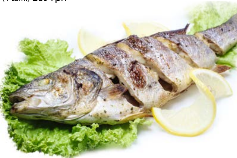
Сібас на мангалі (1 шт.) 289 грн