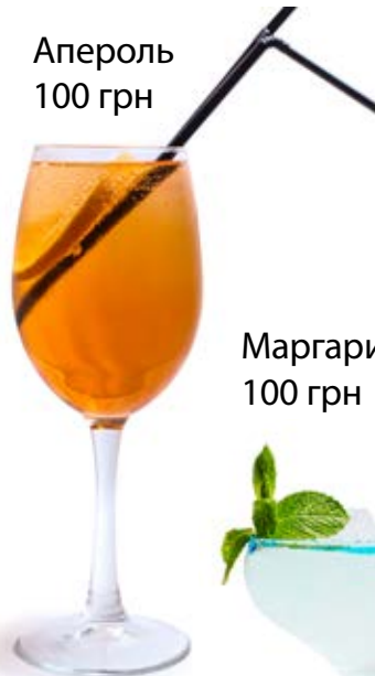
Апероль 100 грн