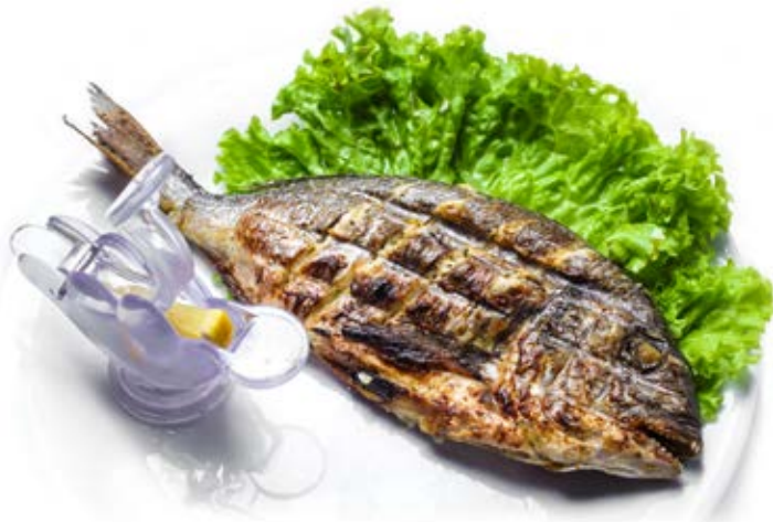
Дорадо на мангалі (1 шт.) 289 грн