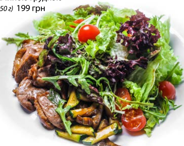
Теплий салат з качиною грудкою (250 г) 199 грн