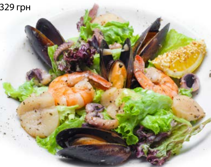
Морська екзотика (280 г) 329 грн