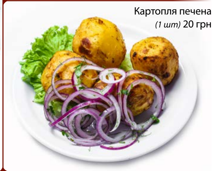
Картопля печена (1 шт) 20 грн