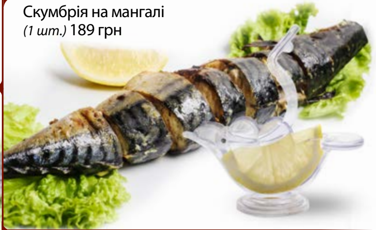
Скумбрія на мангалі (1 шт.) 189 грн