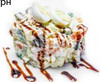
Олів'є з копченою куркою (220 г) 87 грн