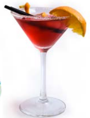
Космополітен 80 грн