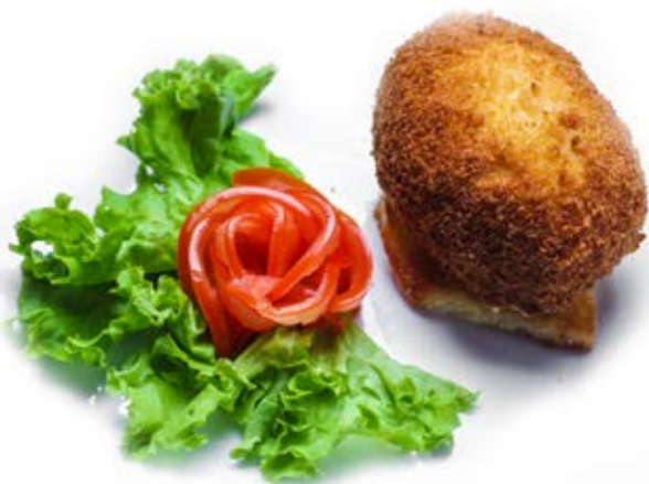
Котлета по-київськи (110/40 г) 98 грн