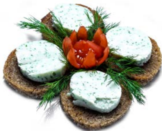
Закуска від кума (190 г) 65 грн