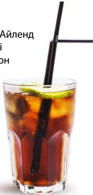
Лонг Айленд Айс Ті 120 грн