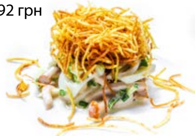
Салат з опеньками, копченою куркою та картоплею пай (210 г) 92 грн