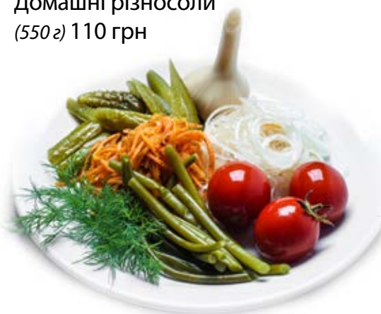
Домашні різносоли (550 г) 110 грн