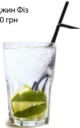
Джин Фіз 90 грн